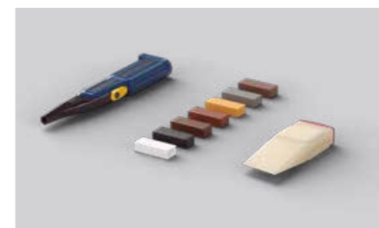
Kit de réparation Pergo PGREPAIR